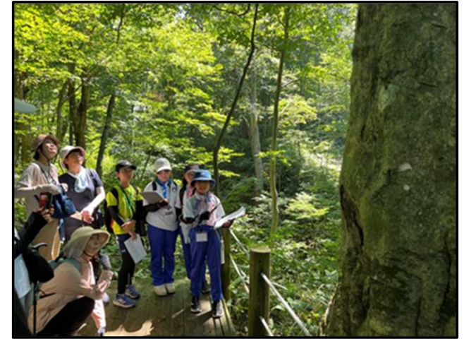
白神ジュニアボランティアガイド育成