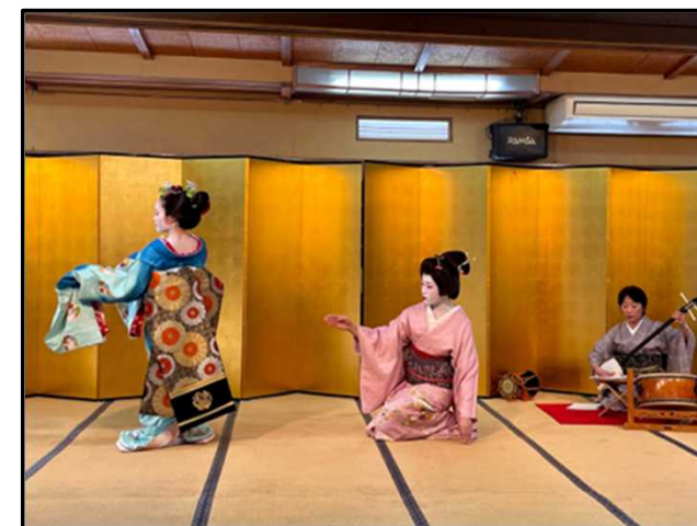
秋田湯沢 湯乃華芸妓