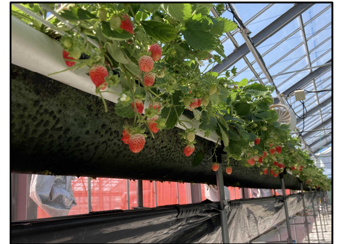
夏秋いちごほ場の様子