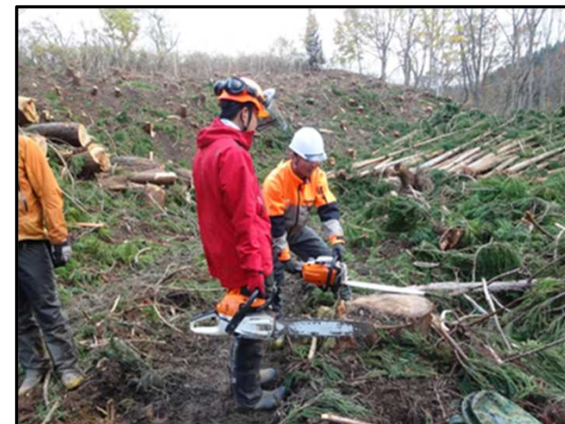
林業インターンシップ