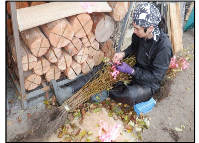
いつでもお試し移住ツアー