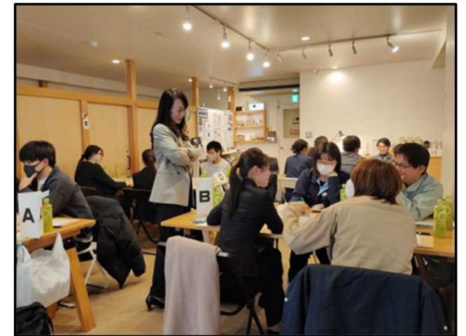
若手社員スキルアップセミナー