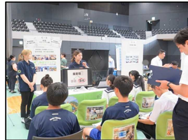
中学生と企業のふれあいPR