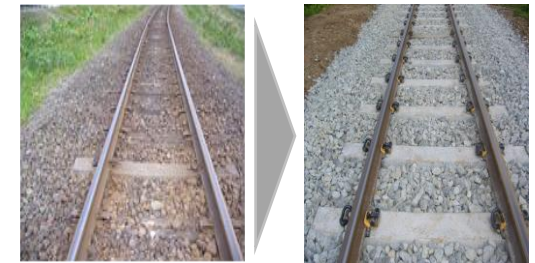
軌道整備 （枕木交換 木製→コンクリート製）

433,710千円 （物価高騰対応重点支援地方創生臨時交付金） （負担金補助及び交付金）