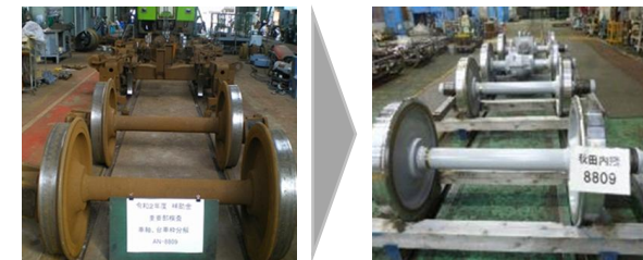
車両検査（車輪削正）