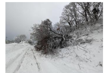
積雪による倒木の様子