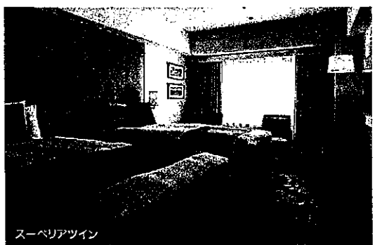
スーペリアツイン

池袋駅より徒歩3分のホテルメトロポリタンでは、会員様限定のお得なプランをご用意。ご家族・ご友人と楽しいひと時をお過ごしください。