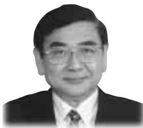
平沢健治 議員(県民クラブ)

A 監察制度の強化により規律保持をしながら、職員提案による風通しのよい職場づくりに努めるほか、仕事に見合った賞揚を図っていくなど、全警察官が治安の重大さとやりがいとを深く認識し、積極的に職務に推進できるよう、自ら先頭に立って進んでまいりたい。