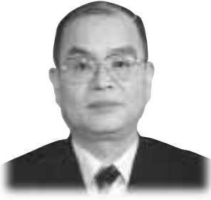
金谷信栄 議員(自民党)

Q 2010年には、全国で120万戸以上の高齢者住宅が不足するだろうと懸念されているが、高齢化が進む中であって高齢者住宅の整備も重要となってくる。