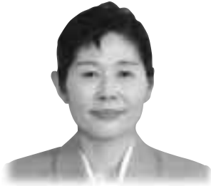
小田美恵子 議員(自民党)

Q 地方分権の流れの中、自主財源の少ない本県にとっては、事業執行にあたって創意工夫が求められると思うが、昨年度国から交付された緊急地域雇用特別交付金や少子化対策臨時特例交付金については、県の事業評価システムの視点を踏まえ、県としての創意工夫はどのような点にあったのか、事業の成果について伺いたい。