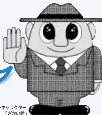
県議会マスコットキャラクター 「ぎかい君」

県議会のホームページには、本会議中継の他にも議員紹介や定例会の審議日程、一般質問の項目、請願・陳情の方法などが掲載されております。