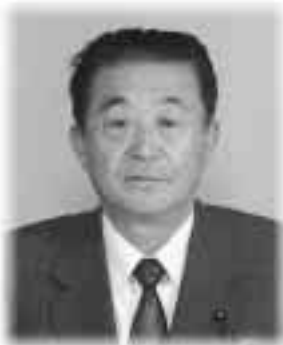
北林照助 議員 (北秋田郡) 自由民主党